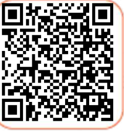
Hasar Kaydı Sorgulama

34PCU264 plakalı aracın SBM kayıtlarını aşağıdaki QR barkodlarından görebilirsiniz.