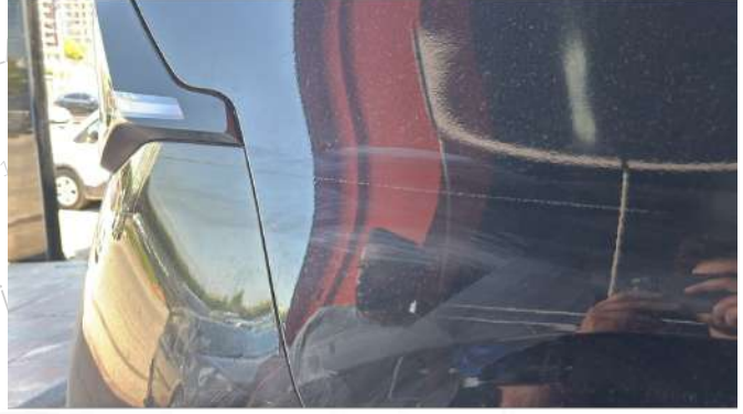
Sağ arka çamurluk çizik