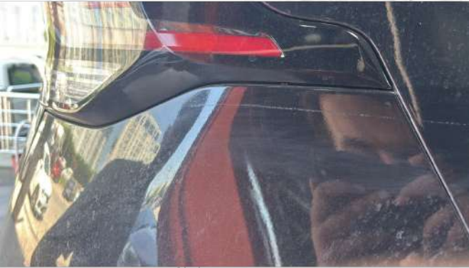
Arka tampon çizik