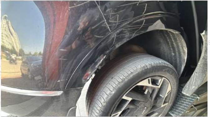
Sağ arka çamurluk dodiği çizik