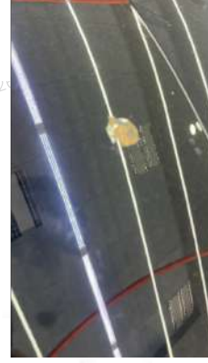
Ön kaput kuş pisiği