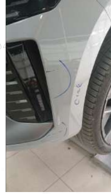
On tampon çizik