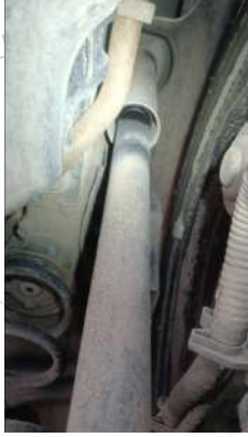
Sag arka amortisör yağ salmış