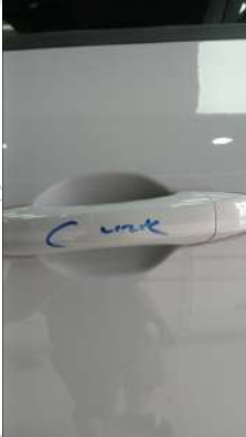
Sol kapı kolu çizik