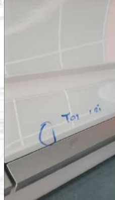
Sag on kapı hafif tas izi