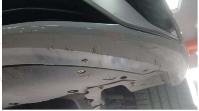
On tampon alt kısımda yoğun çizik mevcut