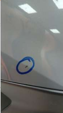
On tampon küçük çizik