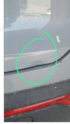
Bagaj ezik mevcut