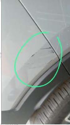
Arka tamponda çizik mevcut