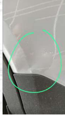
Sag arka kapıda ezik çizik mevcut