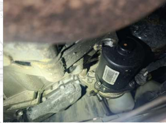
Şanzıman yağ kaçağı var