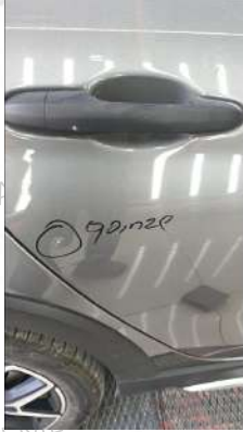
Sağ arka kapı