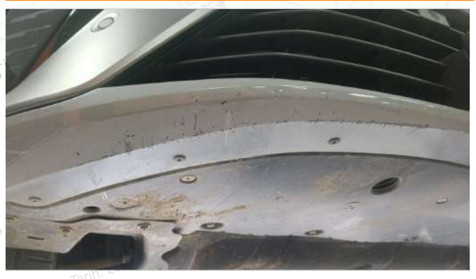
On tampon alt kısmında çizikler var