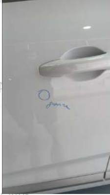
Sol on kapıda gamze var