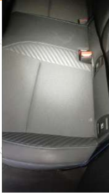
Koltuklar hafif kirlî