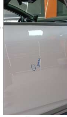
Sag on kapıda gamze mevcut