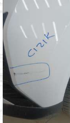
Ön tampon çizik