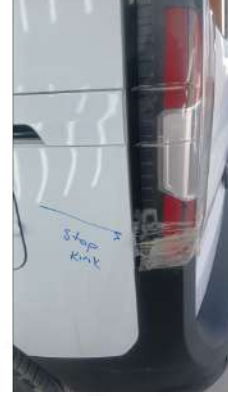
sol stop kırık