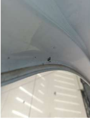
Sol arka kapı içi boyasız düzeltme var