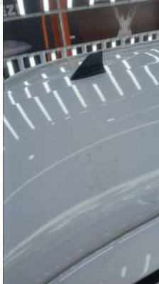
Tavanda kus pislği yanığı mevcut