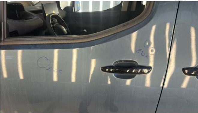
SOL ON KAPIDA EZİKLER VAR