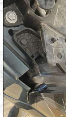
SAĞ FAR AYAGI KIRIK