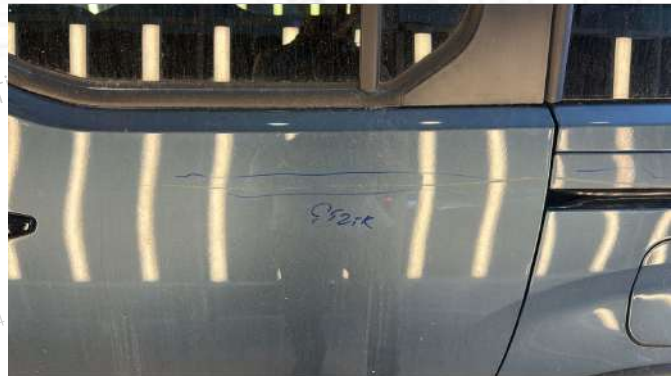
SOL ARKA KAPIDA CIZIKLER VAR