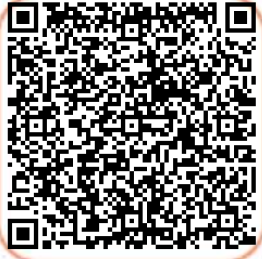
Hasar Detay Sorgulama