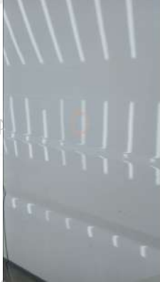
Sag arka kapı ezik