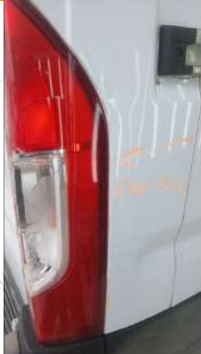
Sag arka stop