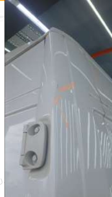
Sag arka camurluk ust kisminda hasar mevcut