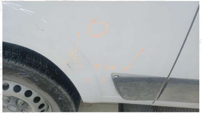
Sag arka camurluk ezik ve dodigi çıkık