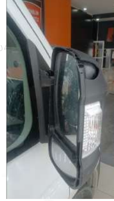
Sag yan ayna plastigi kırık