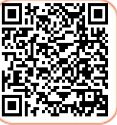
Hasar Kaydı Sorgulama

34NVM037 plakalı aracın SBM kayıtlarını aşağıdaki QR barkodlarından görebilirsiniz.