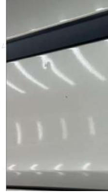
Sağ ön kapı Gamze