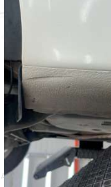
Sağ marşpiyel çizik