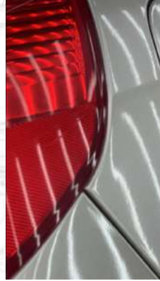
Sağ arka stop Çizik