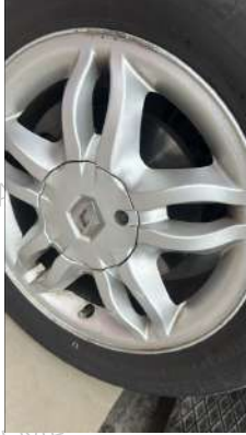
Sağ ol ön jant Çizik