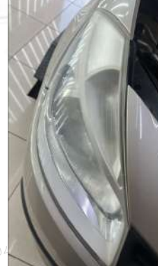
Sağ ön far deforme