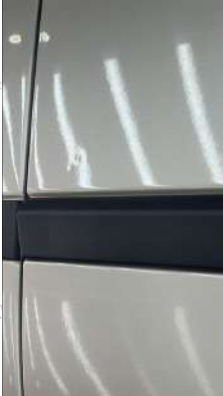
Sağ ön kapı Gamze