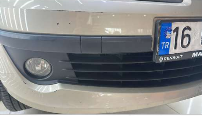
Ön tampon geneli Çizik ve taş izi