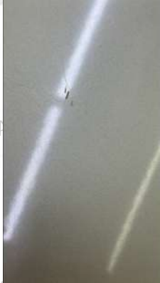
Ön kaput taş izi