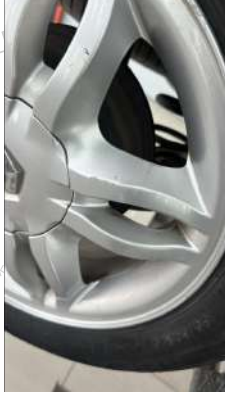
Sağ arka jant Çizik