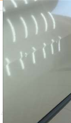
Sol arka kapı Gamzeler mevcut