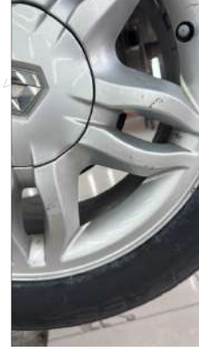
Sol arka jant Çizik