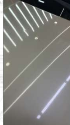
Ön kaput Gamze