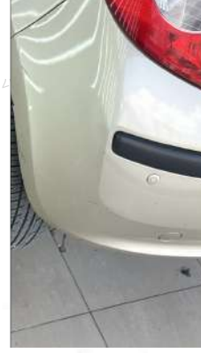
Arka tampon genelinde çizikler mevcut