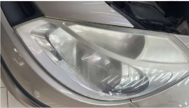
Sol ön far deforme