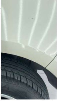
Sol arka Çamurluk çizikler mevcut