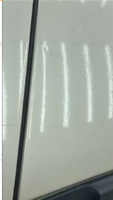
Sol arka kapı Çizik ve Gamze