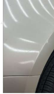
Sol ön Çamurluk kılcal çizikler mevcut