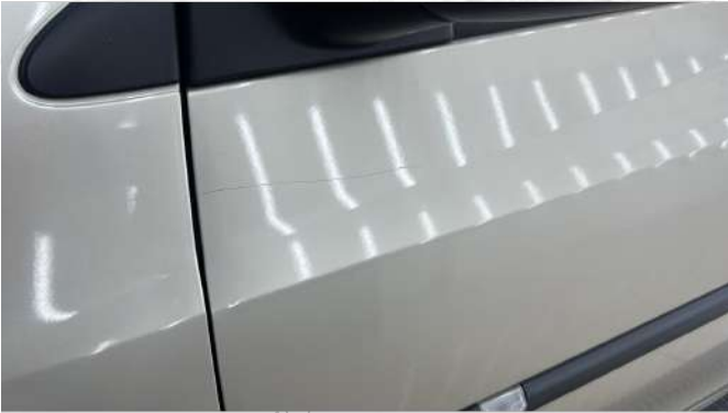
Sol ön kapı Çizik