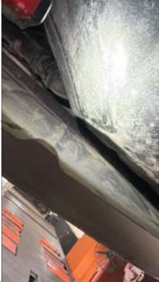
Karterde ezik var