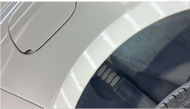
Sağ arka Çamurluk Çizik