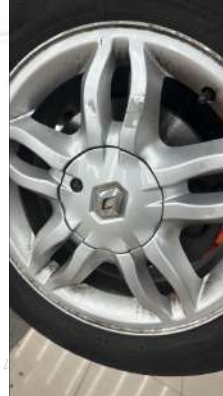
Sağ ön jant deforme