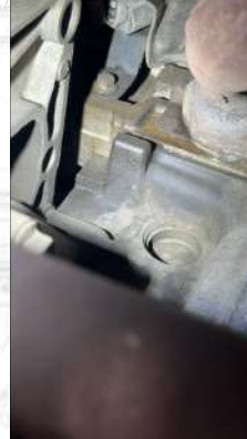
Üst kapakta yağ kaçağı var