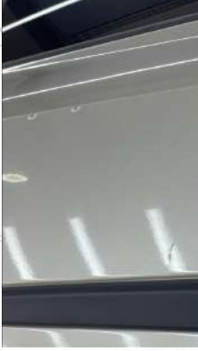
Sağ arka kapı Çizik ve Gamzeler mevcut