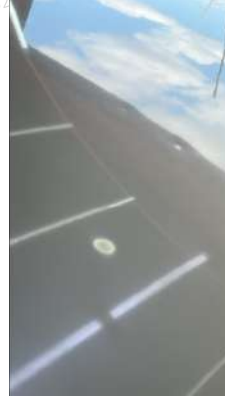
Tavanda Gamzeler mevcut