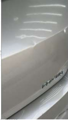
Arka bagaj kapağı Gamze