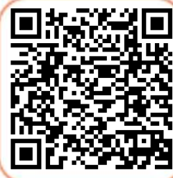
Hasar Detay Sorgulama