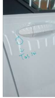
Sag on kapıda tas izi