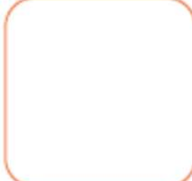
Araç Detay Sorgulama