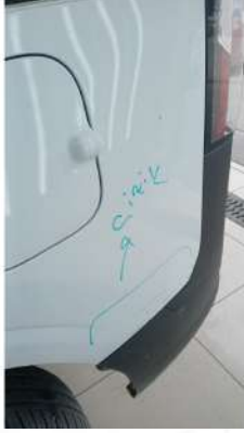
Sol arka camurluk çizik