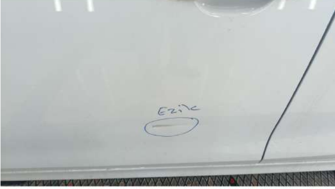
Sol ön kapı ezik