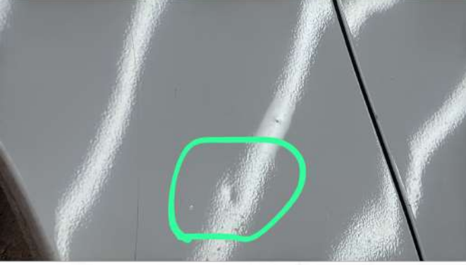
Sağ arka çamurluk ezik