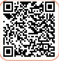
Hasar Kaydı Sorgulama

34NOA003 plakalı aracın SBM kayıtlarını aşağıdaki QR barkodlarından görebilirsiniz.