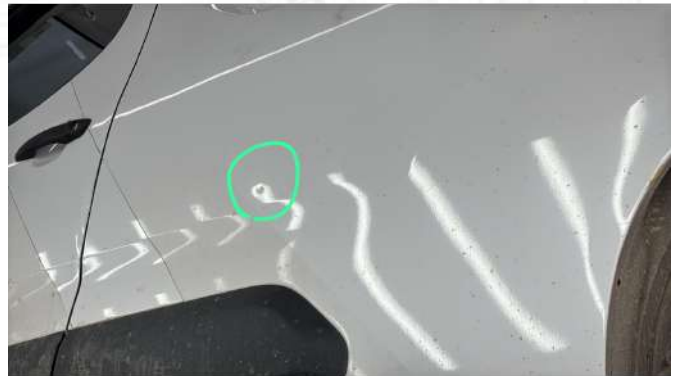
Sol arka çamurluk ezik