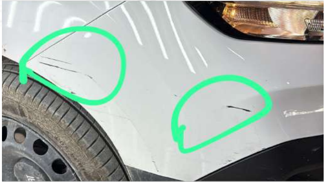
Ön tampon çizik