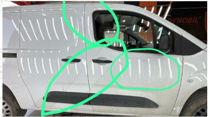
Araç geneli sticker izleri mevcut