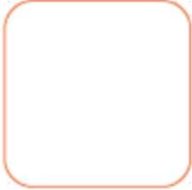
Hasar Detay Sorgulama