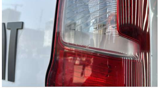
Sağ arka stop çatlak