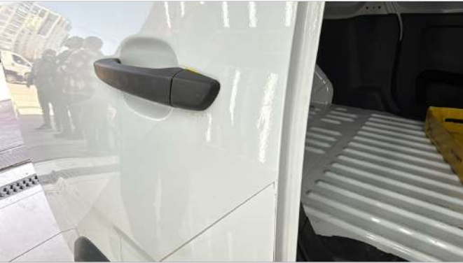
Sağ arka kapı Gamze mevcut