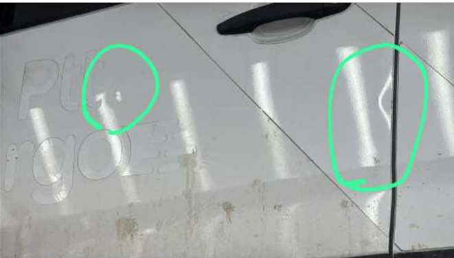
Sol ön kapı ezik