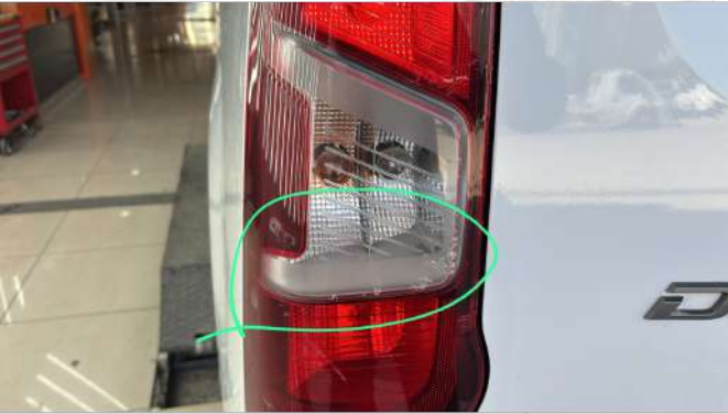
Sol arka stop çatlak